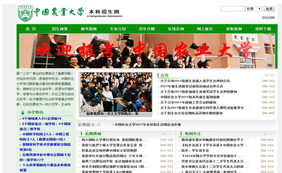
中国农业大学本科招生网页

在学校主页开设本科生招生信息网、研究生招生信息网。按照教育“阳光工程”的要求,学校真正做到招生政策公开、招生资格公开、招生章程公开、招生计划公开、录取程序公开,并及时公开高校自主招生办法、考核程序和录取结果。