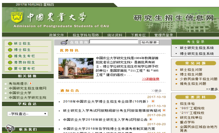
中国农业大学研究生招生网页