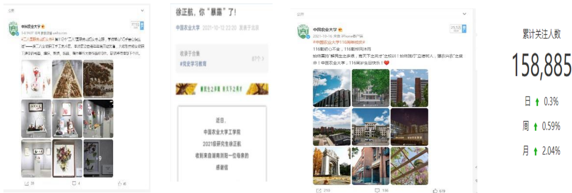
图 1 中国农业大学官方微博、微信

4.通过校报校刊公开情况。 本年度，编发《中国农业大学校报》10期、《中国农业大学校情要报》18期、《中国农业大学信息月报》8期、《中国农业大学信息通报》7期，及时公开学校在党的建设、科研创新、人才培养、人才队伍、社会服务、国际交流、后勤服务等方面的工作情况和典型案例。