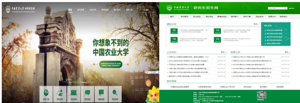
图 3 中国农业大学本科生及研究生招生网页

2.财务信息主动公开情况。 学校将改革发展的重大财务决策、基本财务状况、年度财务预算执行、收支结余、年度工作报告、涉及师生切身利益的财务事项和其他关注焦点、热点、难点财务事项，及时、规范、真实地向师生和社会公众公布。定期在学校信息公开主页主动公开财务预决算信息，2022 年财务预算情况主动公开的内容包括预算表格、文字说明、项目绩效目标表。2021 年财务决算主动公开的内容包括决算表格、文字说明。通过财务微信平台实现财务信息的速递。此外学校还利用在校内设置宣传展板、在财务处网页设置规章制度专栏、向教代会印发《2020 年学校财务工作报告》等多种形式公开学校教育收费信息、日常财务管理制度，通报有关财务工作情况，增强透明度，接受校内外监督。