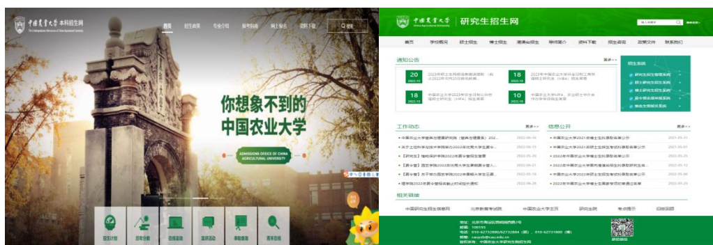
图3 中国农业大学本科生及研究生招生网页

2. 财务信息主动公开情况。 学校将改革发展的基本财务状况、年度财务预算执行、收支结余、年度工作报告、涉及师生切身利益的财务事项和其他关注焦点、热点、难点财务事项，及时、规范、真实地向师生和社会公众公布。定期在学校信息公开主页主动公开财务预决算信息，2023年财务预算情况主动公开的内容包括预算表格、文字说明、项目绩效目标表。2022年财务决算主动公开的内容包括决算表格、文字说明。通过财务微信平台实现财务信息的速递。此外学校还利用在校内设置宣传展板、在财务处网页设置规章制度专栏、向教代会印发《2021年学校财务工作报告》等多种形式公开学校教育收费信息、日常财务管理制度，通报有关财务工作情况，增强透明度，接受校内外监督。