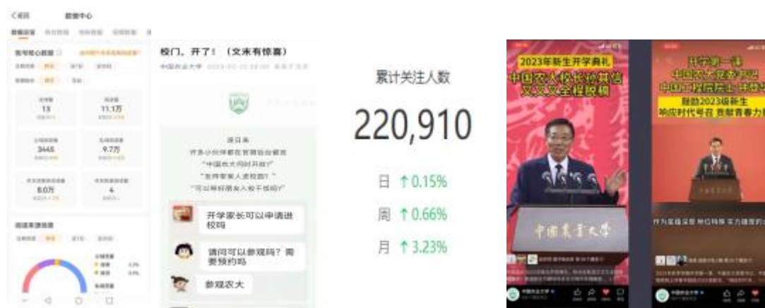
图 1 中国农业大学官方微博、微信、视频号

中心全平台粉丝超 30 万人。全网百万级视频播放量达 8 个，其中《CAUer 很新的毕业照》获得 737 万播放量，《拔穗 8 小时》获得 210 万播放量。视频中心拓展了全景 VR 直播、长直播、慢直播等多种新颖直播形式，过去一年累计直播 5 次，累计观看 375 人次，其中 2023 春季运动会单场直播观看量高达 68.8 万人次。